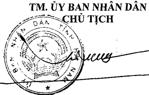
Trương Quốc Huy