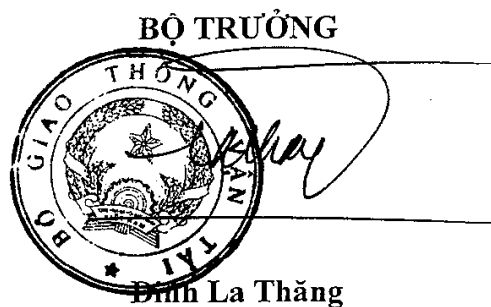
Đinh La Thăng