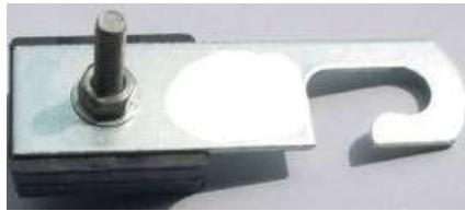
Kẹp xiết bắt dây say công tơ (hình tượng trưng)