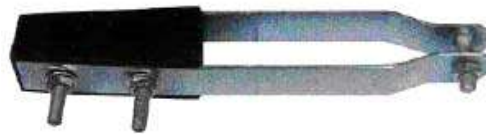
Kẹp xiết (hình tượng trưng)