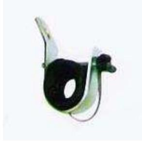
Kẹp treo (hình tượng trưng) Bảng thông số kỹ thuật của kẹp treo: 4x25-35, 4x50-95, 4x95-120, 4x120-150