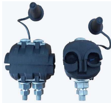
Ghép GN (hình tượng trưng)

Ghép GN được bao bọc bằng nhựa cách điện bền trong mọi thời tiết và phù hợp cho các cấp dây dẫn sử dụng.