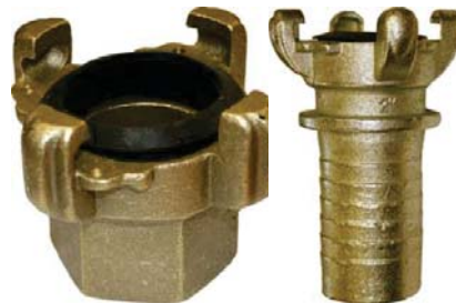
Macdonald quick action couplings