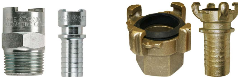
Macdonald quick action couplings