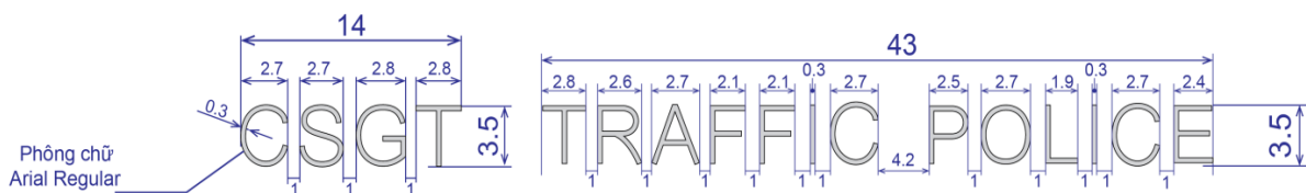
“CSGT TRAFFIC POLICE” bằng công nghệ ẩn chữ, nhìn rõ ở góc 30°

phù hợp với đặc tính kỹ thuật theo hợp đồng thì bên mua có quyền từ chối và bên bán phải